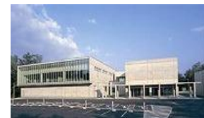
GINOZA VILLAGE IT OPERATION PARK

沖縄県宜野座市において、コールセンターを運営中。 席数規模：25席規模（拡張検討中）